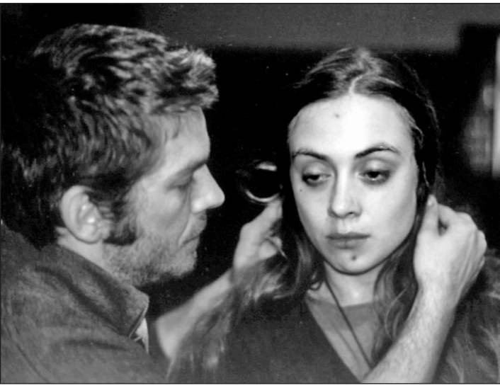
Seit dem vergangenen Jahr bietet die Eifelpolizei ein Drogenpräventionsprojekt in den Sekundarschulen an. Zum Einstieg wird »Jenny«, der Film zu dem Buch »Die Dealerin und der Kommissar« des früheren Drogenfahnders Jörg Schmitt-Kilian, gezeigt.